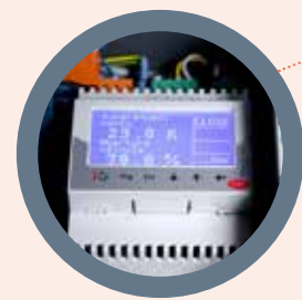
VÁLVULA DE EXPANSIÓN ELECTRÓNICA

AGUA CALIENTE SANITARIA CALEFACCIÓN CENTRAL CLIMATIZACIÓN DE PISCINAS